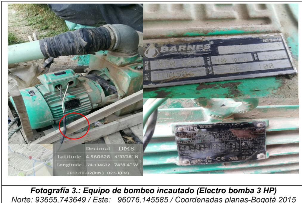
Fotografía 3.: Equipo de bombeo incautado (Electro bomba 3 HP)

Norte: 93655,743649 / Este: 96076,145585 / Coordenadas planas-Bogotá 2015