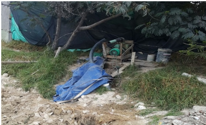
Fotografía 2.: Sistema de bombeo del establecimiento comercial (RUIZ MEZA JORGE GABRIEL)

Desde el punto de vista técnico y analizadas las circunstancias expuestas anteriormente, el Director de Control Ambiental de la Secretaría Distrital de Ambiente procedió a imponer medida preventiva consistente en la suspensión de actividades generadoras de vertimientos y aprovechamiento del recurso hídrico superficial sin debida concesión otorgada por la autoridad ambiental. Adicionalmente se realizó la incautación de los equipos usados para la captación de agua (electrobomba) y el motor utilizado para la trituración de los Residuos de Construcción y Demolición que generaba el vertimiento.