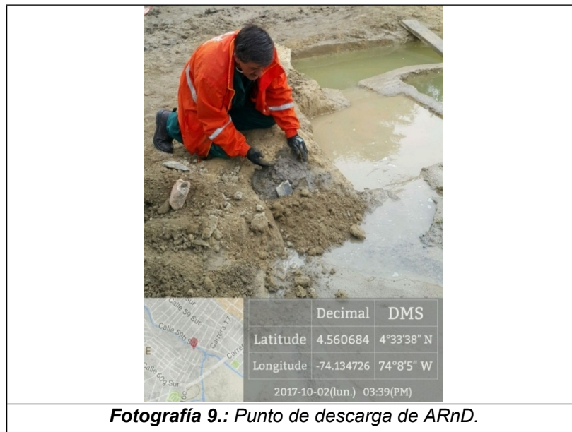
Fotografía 9.: Punto de descarga de ARnD.

Con el apoyo de personal de la Empresa de Acueducto, Alcantarillado y Aseo de Bogotá EAB-ESP se efectuó el taponamiento con concreto del vertimiento generado por las actividades de trituración de materiales pétreos.